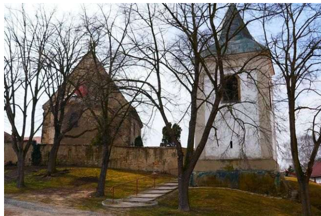
Vykáň – sv. Havel