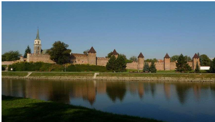
Nymburk – chrám sv. Jiljí