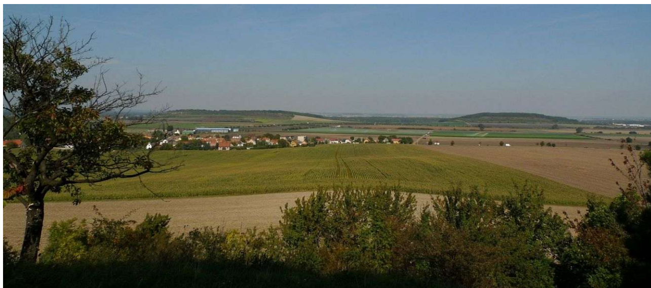
Přerovská hůra (vlevo) a Semická hůra (vpravo) z Břístevské hůry – dávná místa osídlení a svatyní

Obec leží u Městce Králové a má na návrší nenápadný, ale energeticky zajímavý středověký kostel sv. Bartoloměje. Využívá staré energetické místo s křížovou zónou zřejmě z doby raného středověku a na kostely je poměrně silné. Energetické linie vedou do míst vzdálených až 80 kilometrů. Působí zde třetí energie Stvoření, první grál, dimenze éteru a somy a také chvění jsočnosti. Energie éteru podporují a posilují nižší energetické útvary v okolní krajině a energie somy tyto nižší útvary organizují. Místo bude mít význam v transformaci zdejší oblasti.