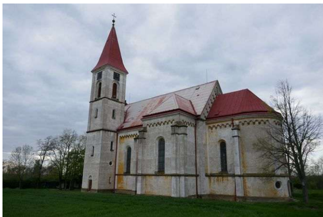
Vrbice – sv. Havel

Obec leží severně od Oškobrhu v sousedství Podmoků a má energeticky zajímavý kostel sv. Havla, dnes v novodobé stavební podobě. Obsahuje energie prvního grálu, somy i jsoucnosti a právě dimenze somy jednak podporují nižší energetické útvary okolní krajiny, jednak určují charakter krajinných energií východního Nymburska a části Kolínska.