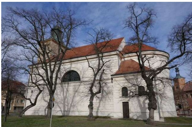
Kounice – sv. Jakub Větší

Leží u Českého Brodu. Zajímavý je zdejší kostel sv. Jakuba Většího, který je propojen dálkovými liniemi s místy až 50 kilometrů daleko. Má energie prvního grálu, somy a jsočnosti, z nichž dimenze somy podporují a ukotvují nižší energetické útvary v okolní krajině.