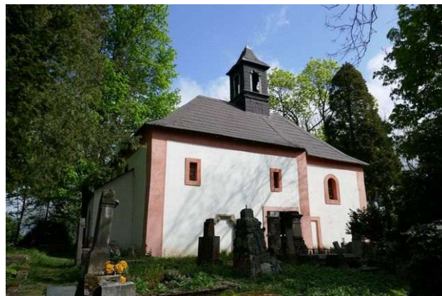
Chotuc u Křince – kostelík Nejsvětější Trojice