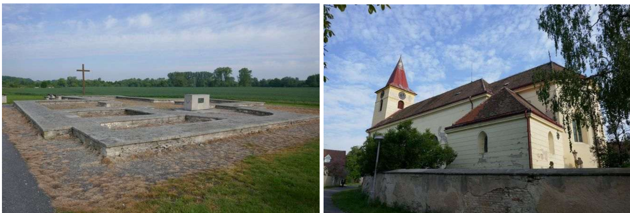
Libické kostely – vlevo akropole hradiště, vpravo sv. Vojtěch

Libice je známá slavníkovským raně středověkým hradištěm. Energetické místo dávného hradu se nachází v oltáři základů kostela na akropoli a je velmi silné – na úrovni lokalit typu Říp. Zvláštností je přítomnost energetické clony, která z určité vzdálenosti brání psychotronicky rozpoznat energetické vyzářování. Po události vyvraždění Slavníkovců v roce 995 zde stále přetrvává otisk negativní mentální energie, který ale nebrání energetickému rozvoji místa. Má dálkové linie vedoucí až 80 kilometrů daleko a nově vytvořenou kruhovou zónu. Působí zde všech sedm energií Stvoření, první grál, dimenze somy a chvění jsoucnosti. Tyto energie kontrolují ochranné energie celého Polabí a ochraňují ho před negativními mimozemskými energiemi.