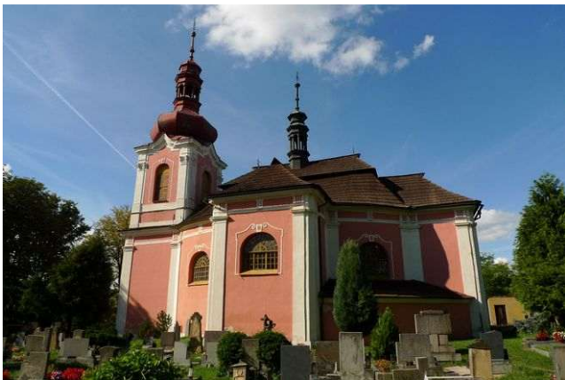
Dymokury – mariánský kostel

Energeticky významný je zdejší barokní kostel Zvěstování Panny Marie, který obsahuje všech sedm energií Stvoření, první a druhý grál, dimenze somy, chvění jsoucnosti a více mimozemských energií. Dimenze somy ukazují Matce Zemi negativní energie umělého původu a spolupracují na jejich odstraňování, zatímco jiná energie je propojena s duchovním centrem Vesmíru.