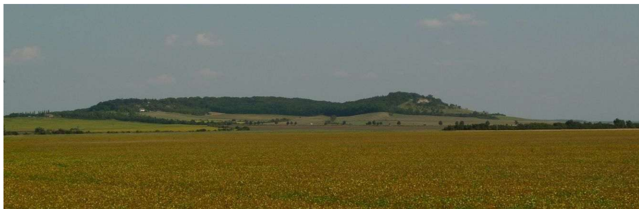
Oškobrh od severozápadu

Historicky i energeticky významným místem je opukové návrší Oškobrh, vystupující sto metrů nad polabskou rovinu. Dnes se bohužel celé nachází v prostoru uzavřené obory a není přístupné. Vizualizovat je možné pouze jihozápadní, vyšší vrchol (285 m), kde je pravděpodobně hlavní energetické místo. Má jinovou polaritu a je poměrně silné, nechybí ani různé energetické útvary včetně pravotočivé spirály s dosahem stovek metrů. Energetické linie vedou do míst vzdálených až sto kilometrů. Z energií mají zatím význam především chvění jsoucnosti, které kontrolují dálkové linie v oblasti Polabí. Dále jsou propojeny s duchovním centrem jiného světa, nebo ukazují Matce Zemi negativní energie Nymburska a pomáhají s jejich odstraňováním.