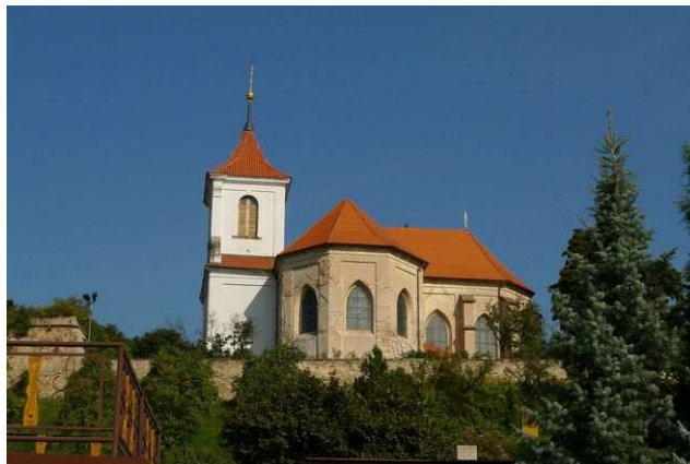
Sadská – sv. Apolinář