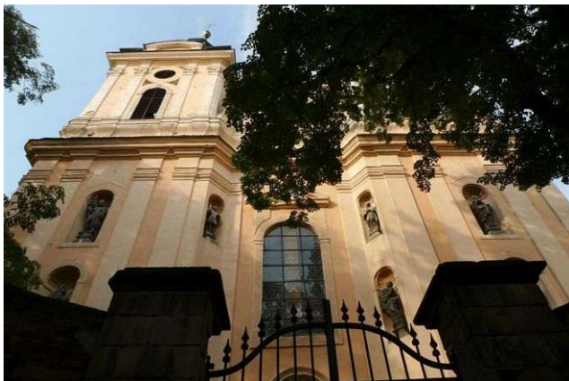
Rožďalovice – sv. Havel

Velký barokní kostel sv. Havla obsahuje všech sedm energií Stvoření, první grál, oblast somy i chvění jsoucnosti a jeho energie somy podporují duchovní růst člověka a krajiny do vzdálenosti deset kilometrů.