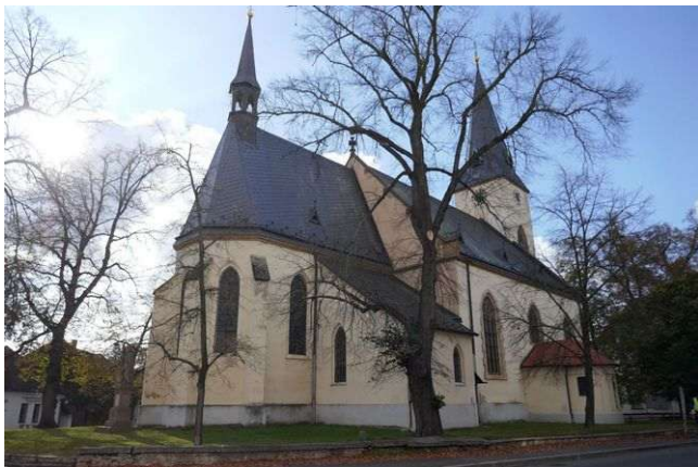
Poděbrady – kostel Povýšení sv. Kříže

Poděbrady mají kromě zámku a lázní také energeticky zajímavý kostel Povýšení sv. Kříže v centru města. Působí v něm sedmá energie Stvoření, prostory Otce Stvořitele a vyšší dimenze, první grál, dimenze somy, chvění jsočnosti a také dva fenomény Věčnosti. Energetické linie odtud vedou až 50 kilometrů daleko.