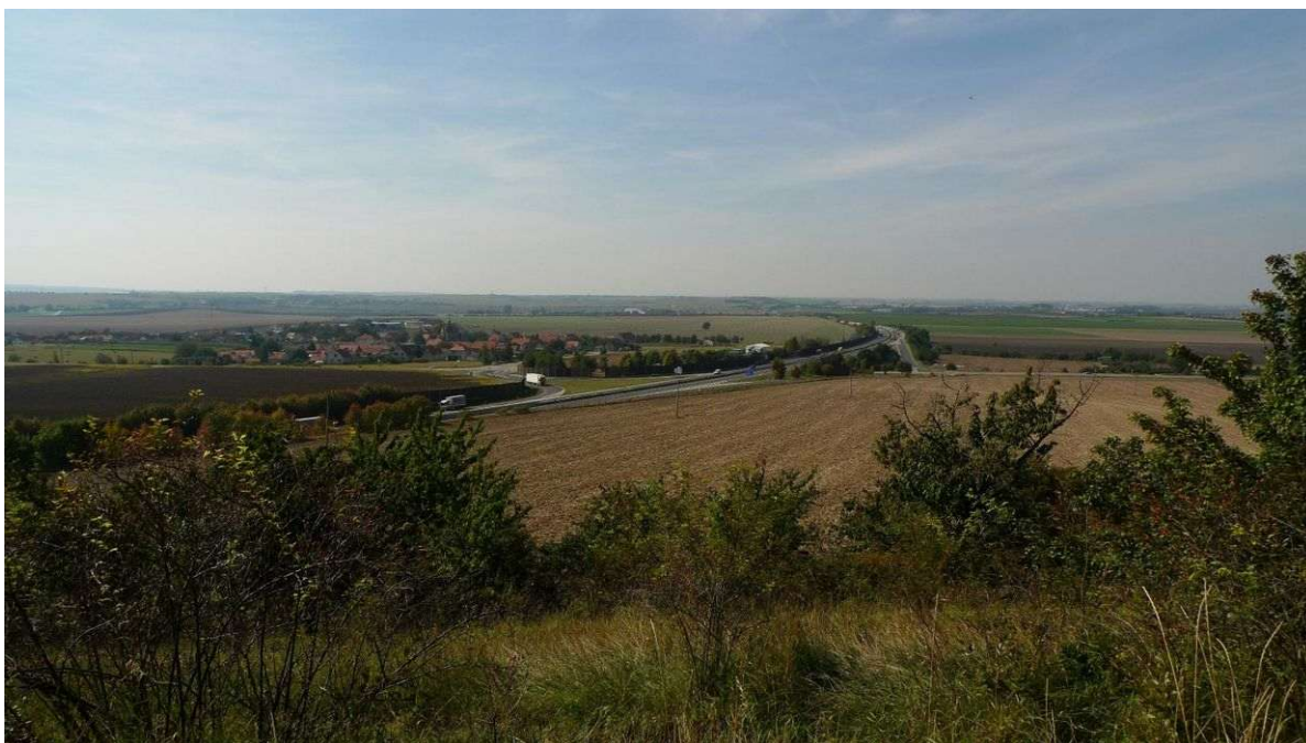
Bříství z Břístevské hůry, návrší Rabákov je vpravo od dálnice

Na obec nezvykle velký kostel Nalezení sv. Kříže má dvě energetická místa pěkné síly – jedno na konci románské lodi a druhé v gotickém presbytáři. Společným působením vytvářejí v kostele všech sedm energií Stvoření, dimenze prostor Otce Stvořitele, první grál, dimenze éteru a somy, chvění jsoucnosti a plejádské energie. Energetické linie vedou až 50 kilometrů daleko.