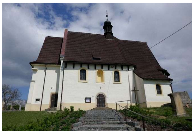
Mcely – sv. Václav