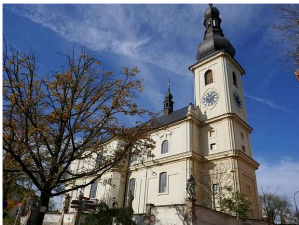
Lysá nad Labem – sv. Jan Křtitel

Významné energetické místo se nachází za zámeckým parkem u lomení ulic Hrabanov a Ke Skále. Má jinový charakter a energetické linie vedou do míst vzdálených až sto kilometrů. Jsou zde pěkné duchovní energie: dvě ze Stvoření, první a třetí grál, soma, jsoucnost a jinový aspekt Věčnosti. Nechybí ani plejádské energie. Energie místa kontrolují stav Matky Země na velkém území, jsou propojeny s energetickými centry jiných světů a také komunikují s nejvyšším vedením Vesmíru. Přes toto místo První Otec (nejvyšší podoba Otce Stvořitele) přímo ovlivňuje krajinu.