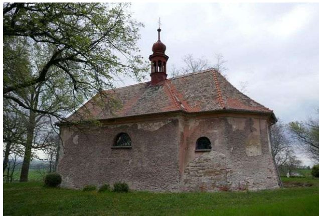
Podmoky – sv. Bartoloměj