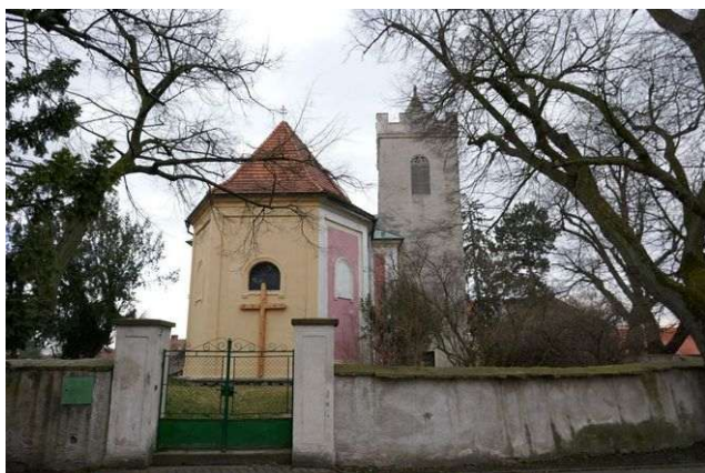
Čečelice – sv. Havel

duchovní růst člověka a krajiny do vzdálenosti asi 15 kilometrů a kontrolují krajinné energie okolní oblasti.