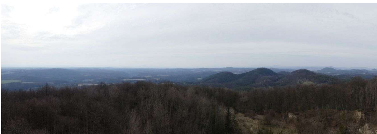
Vrátenská hora – pohled z rozhledny na jižní Kokořínsko, vlevo od středu je na obzoru Říp