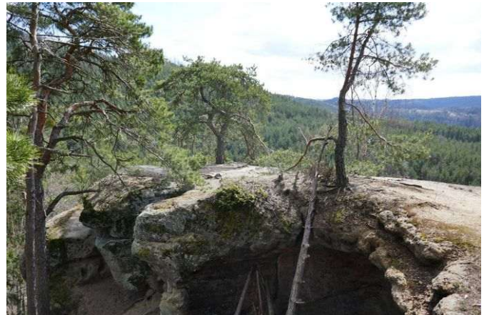
Olešno – hradní skála Zkamenělý zámek