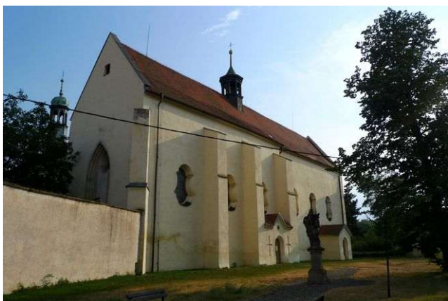
Mělník – klášterní kostel Pšovka

Energeticky významný je vrch Chloumeček (282 m) severovýchodně nad Mělníkem, kde stojí barokní kaple sv. Jana Nepomuckého přestavěná na obytné stavení. Silné místo přírodního původu s jangovou polaritou má střídavý vortex a křížovou zónu, které vytvořil člověk již v dávné minulosti. V uplynulých letech ještě vznikly přírodními procesy větší kruhová zóna a levotočivá spirála působící do vzdálenosti až 20 kilometrů. Energetické linie odtud vedou i 150 kilometrů daleko. Zemská energie propojuje Střed Země s duchovním srdcem Vesmíru a význam mají i zdejší energie. Vyskytuje se tu první energie Stvoření, prostory Otce Stvořitele, první grál, oblast somy i jsoucnost. Ty kontrolují krajinné energie Mělnicka a zajišťují ochranu území před negativními energiemi všeho druhu.