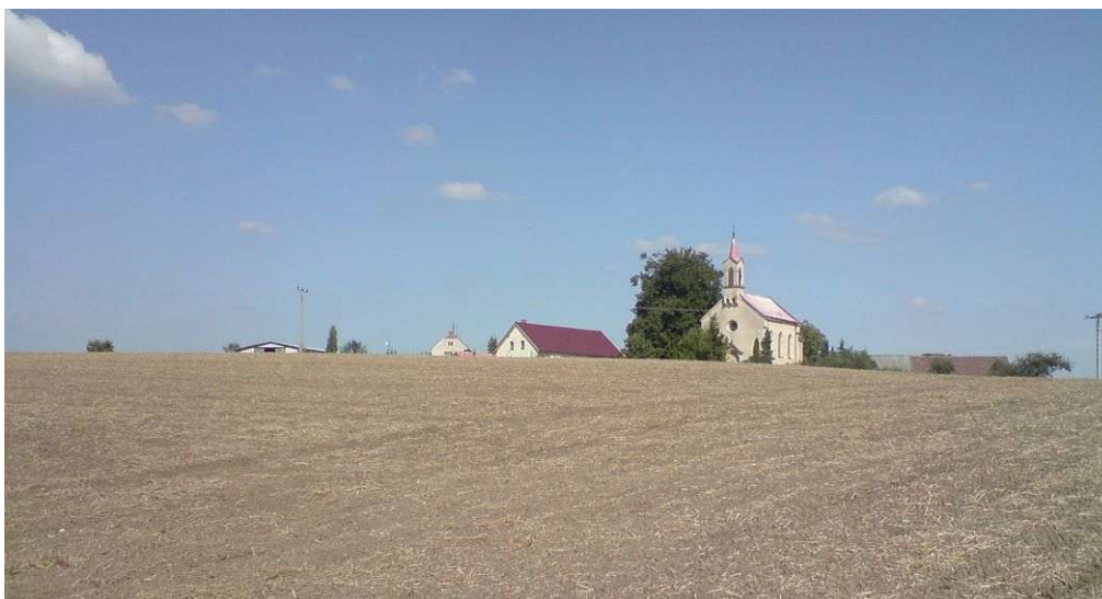
Hradsko u Mšena – akropole hradiště s kostelem sv. Jiří

nálezy z paleolitu, neolitu, eneolitu i starší doby bronzové, ale zdejší energetické místo vytvořil člověk až v mladší době bronzové spolu se založením hradiště. Tehdy, někdy kolem 1100 př. Kr., vznikl i vortex. Energetické místo kostela sv. Jiří je dnes velmi silné a v poslední době bylo přírodními procesy doplněno o křížovou zónu a velkou pravotočivou spirálu s dosahem dva kilometry. Působí zde dvě energie Stvoření, první grál, dimenze somy a chvění jsoucnosti.