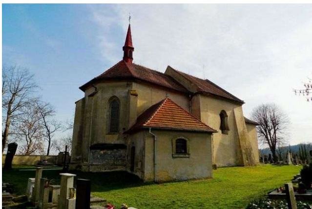
Vepřek – kostel Panny Marie na návrší

Leží u Nové Vsi nedaleko Kralup. Jeho gotický kostel Narození Panny Marie byl postaven na návrší nad Vltavou s pradáváním osídlením napříč pravěkem a využívá přírodní energetické místo jinové polarity. V uplynulých letech zde přírodními procesy vznikly střídavý vortex a kruhová i křížová zóna. Zemská energie propojuje duchovní srdce Matky Země s duchovním srdcem Vesmíru. V kostele působí všech sedm energií Stvoření, dimenze prostor Otce Stvořitele, první grál, dimenze somy i chvění jsoucnosti. Tyto energie kontrolují stav Matky Země v přilehlé oblasti, jsou propojeny s duchovními zdroji jiného světa a dohlížejí na energie Vltavy. Jednak koordinují nižší energetické systémy včetně říčních energií mezi Kralupy a Mělníkem, jednak kontrolují organizaci vltavských energií a jejich propojení s duchovními zdroji vesmíru.