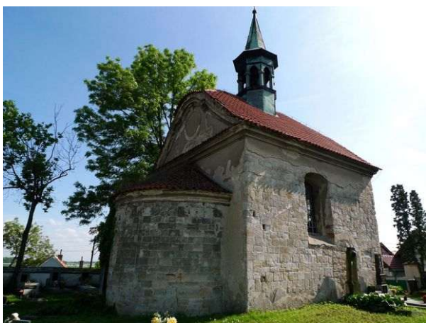
Bukol – románský sv. Bartoloměj

Již v době románské byl na pahorku u Vltavy postaven malý vesnický kostelík sv. Bartoloměje, snad v místech mnohem staršího osídlení, který využil přírodní energetické místo jinového charakteru. Ze starých dob má velkou křížovou zónu i kruhovou zónu a v posledních letech přibyly přírodními procesy také střídavý vortex a malá pravotočivá energetická spirála. Svatyně má čtyři energie Stvoření, dimenze prostor Otce Stvořitele, první grál, oblast somy i jsoucnost. Právě chvění jsoucnosti mají další funkce: Určují duchovní energie, přicházející ze Středu galaxie, pro okolní krajinu, dále jsou propojeny s energetickými zdroji jiného světa a také ochraňují říční energie do vzdálenosti několika kilometrů oběma směry Vltavy. Zemská energie propojuje duchovní srdce Matky Země s duchovním srdcem Vesmíru.