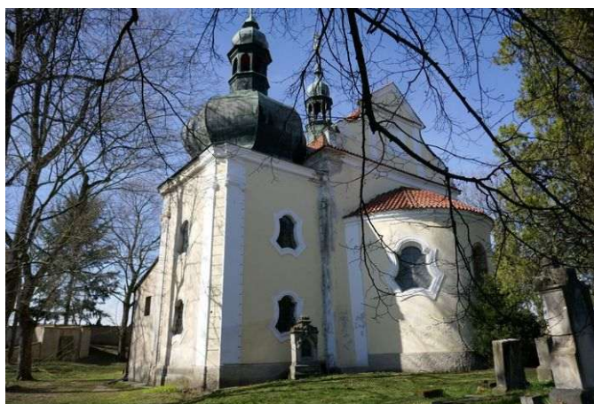
Cítov – sv. Linhart