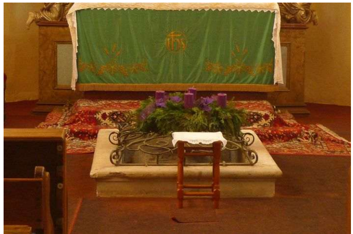
Neratovice – kaple sv. Vojtěcha s energetickým místem