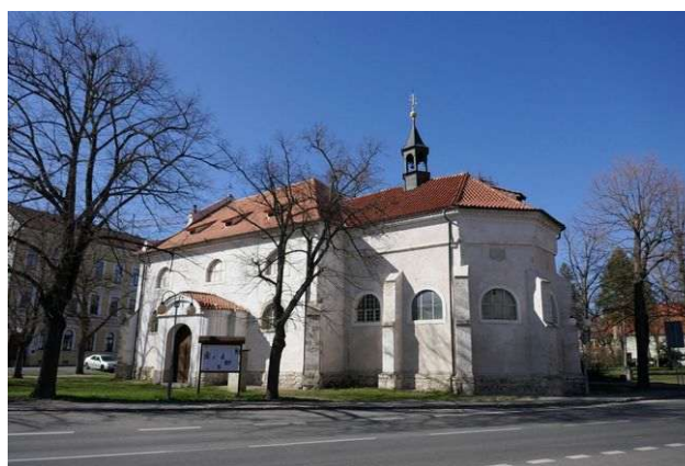
Kostelec nad Labem – vlevo hřbitovní kostel sv. Martina, vpravo sv. Vít na náměstí

Kostel sv. Víta na náměstí má první energii Stvoření, první grál, dimenze somy a chvění jsoucnosti, z nichž energie somy podporují duchovní růst člověka v okruhu až 30 kilometrů, tedy ve velké části středních Čech.