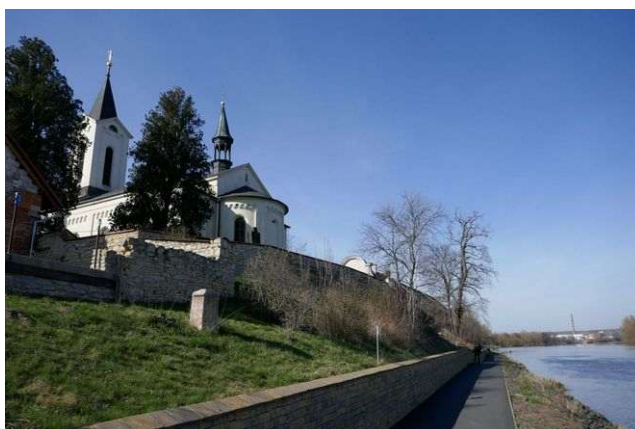
Vlněves – kostel Stětí sv. Jana Křtitele u Labe