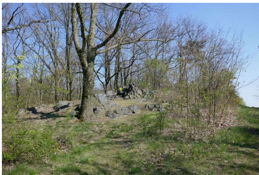
Energetické místo u Kojetic

charakter krajinných energií v oblasti mezi Mělníkem a Prahou. Pro stejné území určuje chvění jsoucnosti strukturu duchovních energií, které přicházejí převážně ze Středu galaxie.