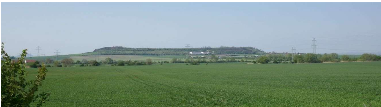
Hora Dřínov v povltavské rovině

Stolová hora Dřínov (247m) představuje dominantu povltavské roviny mezi Kralupy a Mělníkem a v poslední době začíná mít i význam energetický. Její silové místo jinové polarity se nachází v lese v jihozápadní části rozlehlého vrcholu a má různé energetické útvary včetně střídavého vortexu a pravotočivé spirály s dosahem několik stovek metrů. Má velkou sílu a dálkové linie do 40 kilometrů. Působí zde dimenze Otce Stvořitele, první grál, oblast somy a jsoucnost. Energie hory zatím propojují místo s duchovním centrem Vesmíru a kontrolují krajinné energie v širokém okolí.