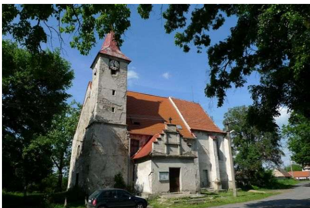
Hostín u Vojkovic – Nanebevzetí Panny Marie