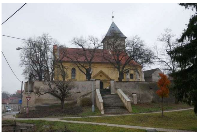
Minice u Kralup – sv. Jakub Větší

V místní části Minice stojí středověký kostel sv. Jakuba Většího, který má šestou energii Stvoření, první grál, energie somy a chvění jsoucnosti. Funkcí místa je například kontrola Matky Země při využívání duchovních transformačních energií kladensko-mělnického regionu.