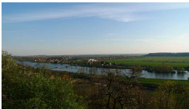
Liběchov – vyhlídkové místo s kaplí sv. Ducha