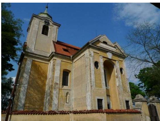
Chlumín – sv. Maří Magdaléna

Leží v labsko-vltavské rovině a má energeticky zajímavý kostel sv. Maří Magdalény. Ten byl postaven na přírodním energetickém místě – snad na staré pravěké svatyni – s jinovou polaritou, ale jen nadprůměrnou silou. Z energií zde najdeme pouze první grál a dimenze somy, které podporují duchovní růst krajiny v širokém okolí Mělnicka.