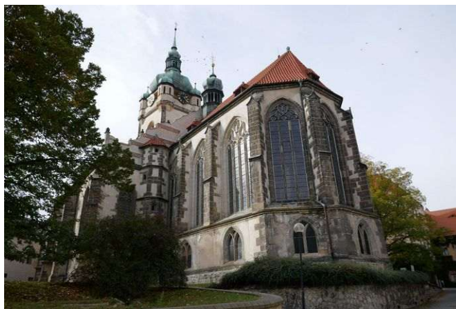
Mělník – kostel sv. Petra a Pavla

Energeticky významný je vrch Chloumeček (282 m) severovýchodně nad Mělníkem, kde stojí barokní kaple sv. Jana Nepomuckého přestavěná na obytné stavení. Silné místo přírodního původu s jangovou polaritou má střídavý vortex a křížovou zónu, které vytvořil člověk již v dávné minulosti. V uplynulých letech ještě vznikly přírodními procesy větší kruhová zóna a levotočivá spirála působící do vzdálenosti až 20 kilometrů. Energetické linie odtud vedou i 150 kilometrů daleko. Zemská energie propojuje Střed Země s duchovním srdcem Vesmíru a význam mají i zdejší energie. Vyskytuje se tu první energie Stvoření, prostory Otce Stvořitele, první grál, oblast somy i jsoucnost. Ty kontrolují krajinné energie Mělnicka a zajišťují ochranu území před negativními energiemi všeho druhu.