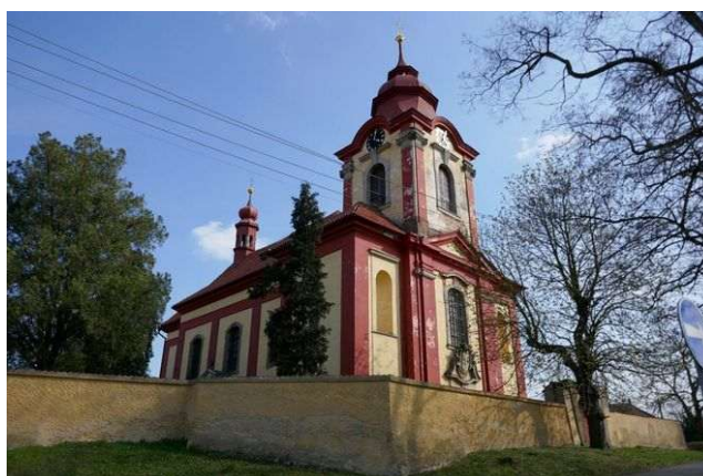
Ledčice – sv. Václav