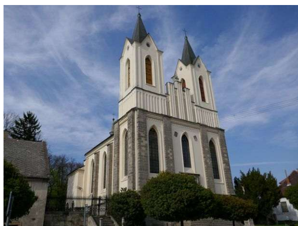
Řepín – kostel Panny Marie Vítězné