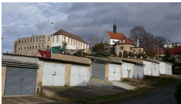
Chvatěruby – zámek s kostelem sv. Petra a Pavla