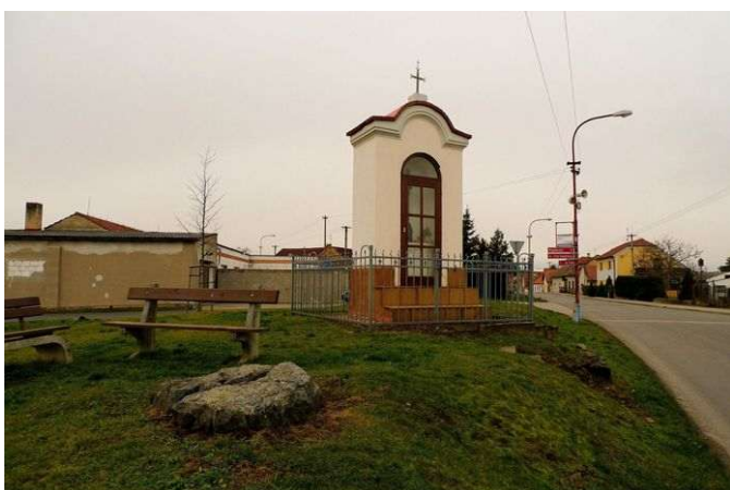
Předboj – energetické místo u božích muk

Leží jihozápadně od Neratovic. Na východním okraji obce stojí u silnice kaplička a u ní se nachází rozpuklý kámen na energetickém místě, které v zimě 2026 výrazně transformovalo a posílilo. Vytvořil ho člověk již dávno v pravěku a z té doby je možná i samotný kámen. Střídavý vortex je poměrně velký a má kolem deseti metrů v průměru, levotočivá spirála dosahuje až do deseti kilometrů a nechybí ani křížová a kruhová zóna. Energetické linie vedou až 90 kilometrů daleko. Aktuálně zde působí dvě energie Stvoření, první grál, oblast somy a jsočnost. Pro člověka jsou významné energie somy, které mají léčivé schopnosti se zaměřením na slinivku a slezinu. Další energie komunikují s duchovním centrem Vesmíru, kontrolují duchovní energie krajiny mezi Prahou a Mělníkem nebo jsou propojeny s duchovními centry jiných světů. Chvění jsočnosti dále kontrolují stav Matky Země v přilehlé oblasti a odstraňují na stejném území některé druhy negativních mimozemských energií. Významná je také zdejší zemská energie.