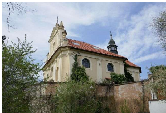
Chloumeček u Mělníka