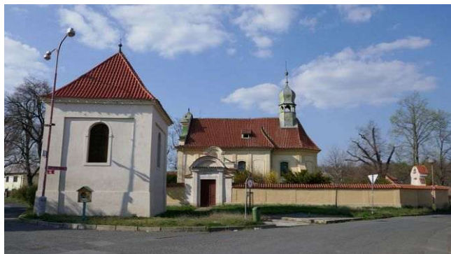
Vpravo: Lobkovice u Neratovic – Panna Marie Vlevo: Libiš u Neratovic – sv. Jakub