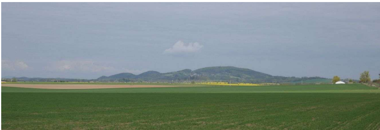
Vrátenská hora a vlevo Housecké vrchy středního Kokořínska

Zdaleka viditelná krajinná dominanta nabízí daleké výhledy z rozhledny, ale za jejím energetickým místem musíme dále lesem až na vlastní vrcholovou kótu. Hora má jinovou energii a silou odpovídá Řípu, je tedy veliká. Ke staré křížové a kruhové zóně nedávno přibyl také střídavý vortex. Pro člověka je zajímavá zemská energie, jejíž složka má schopnost léčit slinivku a slezinu. Z energií zde působí první grál, dimenze somy, jsoecnost a jinový aspekt Věčnosti. Dimenze somy jsou napojeny na nejvyšší Vědomí Vesmíru, komunikují s duchovním centrem Vesmíru a kontrolují krajinné energie v okolí se zaměřením na skalní oblast Kokořínska. Jsou také součástí zdejšího energetického systému a dále mají schopnost rozpoznávat negativní energie vytvořené člověkem na územích daleko na všechny strany.