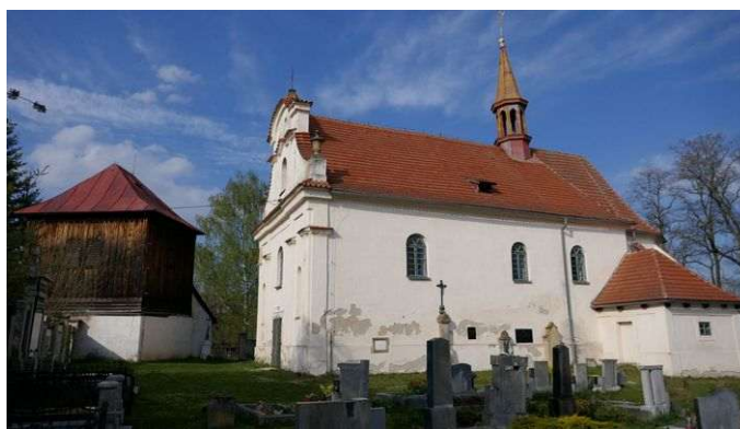
Kadlín – návrší Hradišť (Hradiště) a kostel sv. Jakuba Většího

Energeticky významný je také goticko-barokní kostel sv. Jakuba Většího v obci. Je propojen energetickými liniemi s místy vzdálenými až sto kilometrů a má zajímavou zemskou energii. Ta určuje transformační energie pro vnitřní části planety pod úrovní povrchu ve spolupráci s energiemi somy; jejich působnost je 150 kilometrů všemi směry včetně do nitra Země. Samotný kostel je poměrně silný a z energií má první grál, dimenze somy a jsočnost. Právě chvění jsočnosti ukazuje Matce Zemi negativní energie přilehlé krajiny Mělnicka a Boleslavska a podílí se na jejich odstraňování. Další chvění propojuje místo s Vědomím jsočnosti a v budoucnosti i s Vědomím Věčnosti.