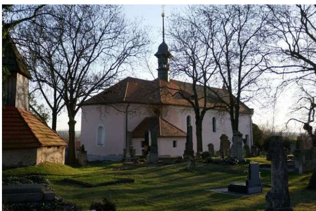
Nabdín – sv. Barbora

letech zde přírodními procesy vznikly střídavý vortex, křížová a větší kruhová zóna a rovněž velká levotočivá spirála ovlivňující krajinu až do 50 kilometrů. Zemská energie propojuje duchovní srdce Matky Země s duchovním srdcem Vesmíru a její složka působí léčivě na srdce, a to i vně kostela. V místě působí mnoho různých energií – všech sedm energií Stvoření, dimenze prostor Otce Stvořitele, první a třetí grál, oblasti éteru a somy, jsoucnost a tři fenomény Věčnosti včetně toho nejvýznamnějšího – prvotní příčiny Věčnosti. Energie plní také řadu dalších funkcí. Dimenze somy kontrolují šíření duchovních energií na širokém území včetně napojení na energetické systémy Prahy s okolím a další z dimenzí určuje pořadí duchovních energií pro krajinu, které přicházejí ze Středu galaxie. Jiná energie somy ukazuje Matce Zemi poruchy energetických systémů v oblasti Kladenska, Mělnicka a dolního Poohří a prostřednictvím chvění jsoucnosti a grálových energií koordinuje nápravu. Další chvění propojují místo s duchovními centry jiných světů podle aktuální potřeby a eliminují negativní mimozemské energie v části středních a severozápadních Čech.