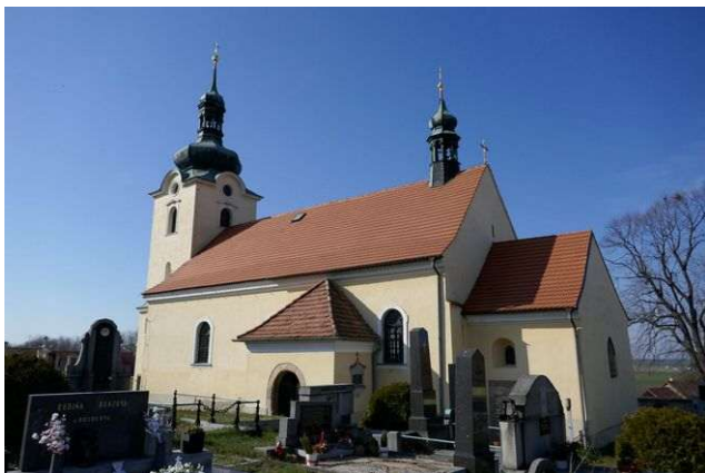
Dřínov – sv. Lukáš

Leží severně od Slaného a má zajímavý kostel sv. Lukáše. Energetické místo kostela je spojeno energetickými kabely s místy vzdálenými až 60 kilometrů. Působí zde druhá energie Stvoření, první grál, oblast somy a chvění jsoucnosti. Dimenze somy například určuje pořadí krajinných energií přicházejících ze Středu galaxie, které jsou určeny k rozvoji nižších energetických útvarů v okolí. Chvění jsoucnosti jsou propojené s duchovním centrem jiného světa a dále pracují s energetickými bloky Matky Země, které rozvolňují na území do vzdálenosti několika desítek kilometrů.