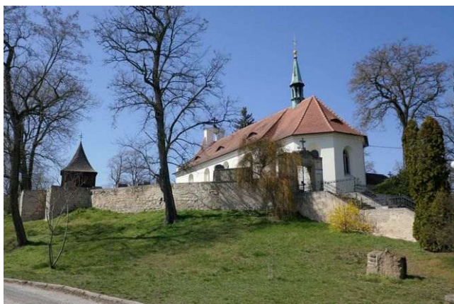
Tuřany – kostel Panny Marie

Nachází se západně od Slaného. Středověký kostel Nanebevzetí Panny Marie obsahuje dvě energie Stvoření, první grál, dimenze somy, chvění jsoucnosti a dálkovou linií je propojen s Kunětickou horou – významným energetickým místem východních Čech u Pardubic.