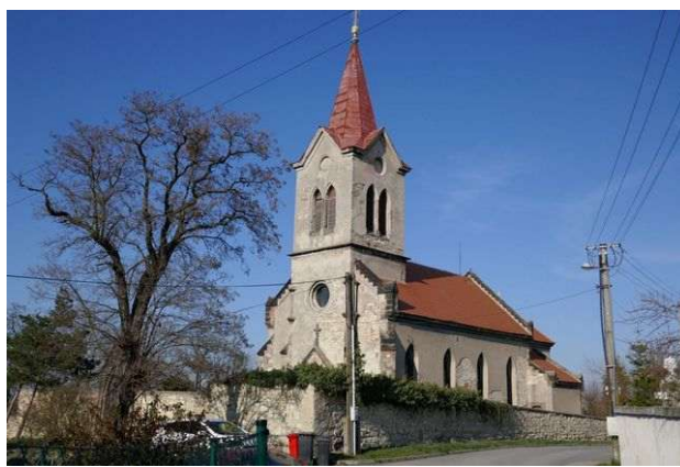
Dolín – sv. Šimon a Juda