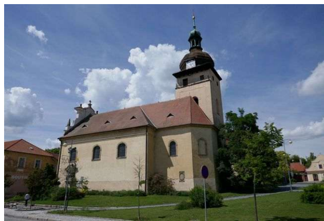
Unhošť – sv. Petr a Pavel