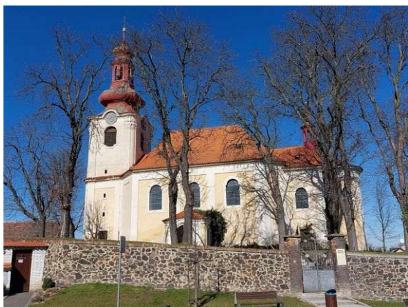
Hostouň – sv. Bartoloměj

Leží mezi Prahou a Kladnem. Významný je zdejší barokní kostel sv. Bartoloměje postavený na přírodním energetickém místě jangového charakteru, které je svými energiemi vhodné především pro muže a mohli bychom ho proto označit za mužskou svatyni. Kostel má velmi pěkné duchovní energie: dvě ze Stvoření, všechny tři grálové energie, oblast somy, jsoucnost, tři fenomény Věčnosti a aktuálně i plejádské energie. Dimenze somy podporují duchovní růst člověka nejen v kostele, ale i v okolní krajině. Jiná dimenze ukazuje Matce Zemi negativní energie umělého původu a určuje způsob jejich odstraňování, nebo je propojena s duchovním centrem Vesmíru.