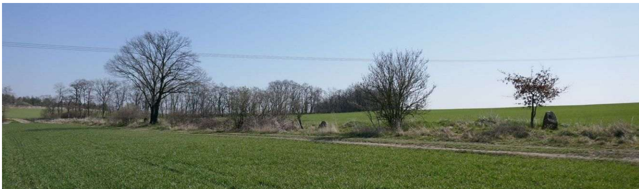
Trojice menhirů na hranici katastrů Přelíc a Řisuty – vpravo západní kámen

Západní Slánsko je krajinou, kde začínají dochované menhiry – člověkem vztyčené kameny, jejichž stáří zůstává záhadou. Archeologicky ani historicky neexistují možnosti, jak je datovat a právě psychotronika k tomu nabízí zajímavé řešení. Menhiry byly totiž v pravěku často instalovány na energetických místech, což mělo více důvodů. Ty hlavní byly v tom, že se energetický proud stabilizoval na konkrétním místě a byl využitelný po dlouhou dobu, a právě menhir nové návštěvníky upozorňoval na duchovně zajímavé místo. Pokud tedy kandidát na menhir stojí na energetickém místě, je téměř stoprocentní, že jeho stáří je pravěké (například Zkamenělý pastýř u Klobuk, menhir u Jemníků).