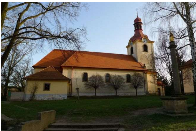
Družec – kostel Panny Marie byl možná postaven na místě staré svatyně s původním menhirem

V obci se nachází jeden z našich větších dochovaných menhirů, ale již nikoliv na svém původním místě – je opřen v koutě ohradní zdi bývalého hřbitova před kostelem. Kámen je dnes mrtvý a jeho psychotronické stáří ukazuje kolem 3800 př. Kr. Zdá se, že původně mohl stát na stejně starém energetickém místě, kde byl později postaven kostel Nanebevzetí Panny Marie.