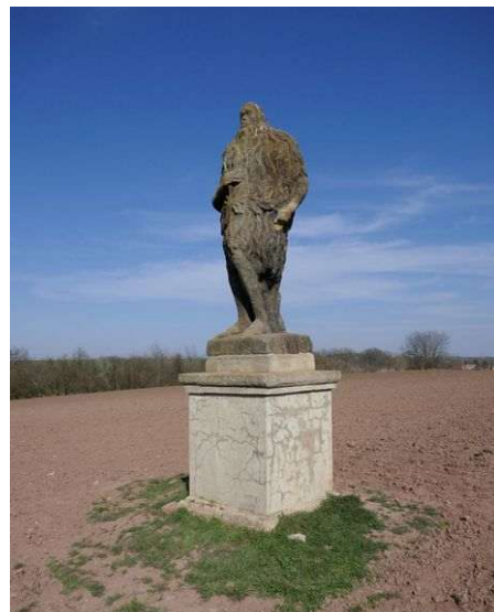
Zlonice – mariánský kostel a socha sv. Onufria