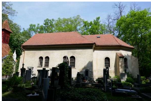
Kladno – oba energeticky významné kostely