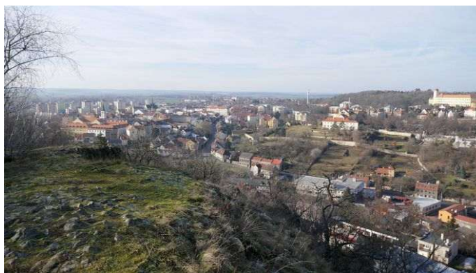
Slaný – sv. Gothard a za ním Slánská hora, vpravo výhled ze Slánské hory na město

Slánská hora (330m) na okraji města je významnou archeologickou lokalitou zejména z období středního eneolitu, zajímavá je ale i z pohledu energií. Jangové energetické místo se nachází na skalnaté části vrcholu, odkud je výhled na město, a má sílu podobnou kostelu sv. Gotharda. V posledních letech vznikly přírodními pochody střídavý vortex a kruhová i křížová zóna. Dálkové linie vedou až sto kilometrů daleko. Působí zde dvě energie Stvoření, všechny tři energie grálů, oblast somy, jsoucnost a jangový aspekt Věčnosti. Energie hory jsou propojeny s nejvyšším Vědomím Vesmíru, s Vědomím jsoucnosti i s Vědomím Věčnosti. Jedna z energií somy kontroluje krajinné energie velké části středních a severozápadních Čech. Chvění jsoucnosti ukazuje Matce Zemi negativní energie všeho druhu a určuje způsob jejich odstraňování, zatímco další chvění využívá energetické zdroje jiných spirálních galaxií podle aktuální potřeby transformace krajiny. Zemská energie propojuje duchovní srdce Matky Země s duchovním srdcem Vesmíru.