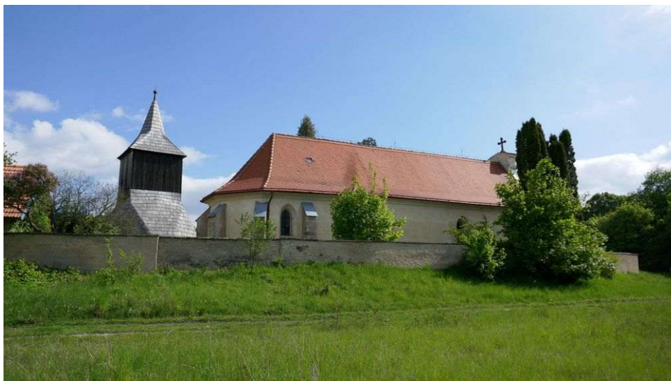
Libušín – kostel sv. Jiří uprostřed hradiště

Západně od Kladna leží významné raně středověké hradiště Libušín, které existovalo od 9. do 11. století. Uprostřed areálu se nachází kostel sv. Jiří, jehož silné energetické místo je na konci lodi před gotickým presbytářem a naznačuje tak umístění nejstarší kostelní stavby. Místo má ale zřejmě mnohem starší minulost, neboť silový bod vytvořili lidé nejspíš už v pravěku včetně křížové zóny. Naproti tomu střídavý desetimetrový vortex, velká kruhová zóna i levotočivá spirála s dosahem až dvacet kilometrů vznikly přírodními procesy teprve v posledních letech. Síla kostela je dnes větší než bývá u kostelů obvyklé. Působí zde všech sedm energií Stvoření, první grál, dimenze somy a jsoucnost. Chvění jsoucnosti koordinují krajinné energie okolní oblasti, podílejí se na energetické regeneraci krajiny a také určují strukturu krajinných energií okolního území.