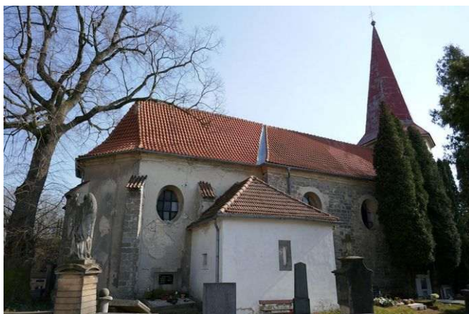
Chržín – sv. Kliment