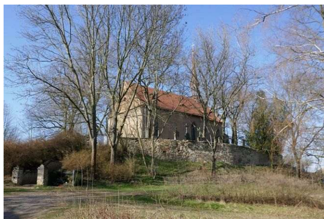
Otruby – sv. Jakub Větší v Lidici