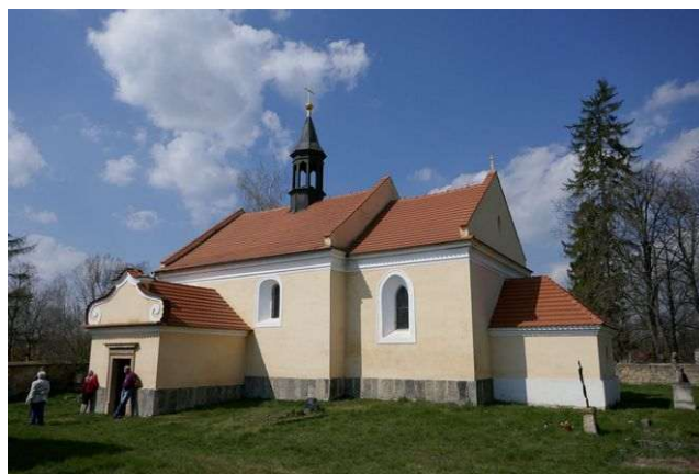
Malovary u Velvar – kostelík Všech svatých