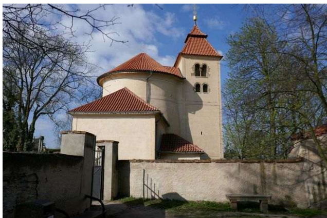
Budeč – sv. Petr a Pavel na hradišti

Naproti rotundě jsou na louce odkryty základy románského kostelíka Panny Marie, které mají ve středu apsidy také energetické místo. Je ale jen nadprůměrně silné a má pouze třetí energii Stvoření.