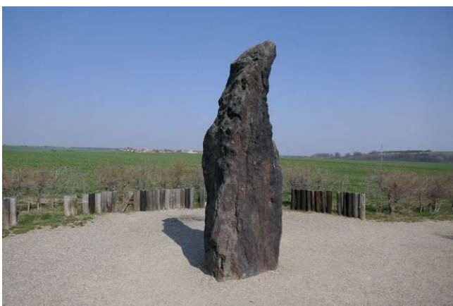
Klobuky – menhir Zkamenělý pastýř

V tomto přehledu nelze vynechat náš nejznámější pravěký menhir Zkamenělý pastýř v polích u Klobuk. V menhiru je silové místo, ale pouze nadprůměrných hodnot, a v současnosti obsahuje dimenze prostor Otce Stvořitele, první grál, dimenze somy a chvění jsoucnosti bez zvláštních funkcí. Pokud nás zajímá stáří menhiru, s tradičními historickými metodami neuspějeme, jednoduše to neumí. Pokud přizveme na pomoc psychotronické metody, získáme stáří kolem 3300 př. Kr. a určitou možnost, že kolem menhiru býval kamenný kruh; to by naznačovaly i staré pověsti vážící se k tomuto místu.