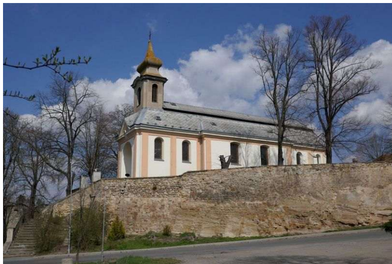
Zvoleněves – kostel sv. Martina

Kostel sv. Martina na východním Slánsku se řadí mezi významné energetické lokality nadregionálního významu. V současnosti obsahuje sedmou energii Stvoření, první grál, dimenze éteru a somy a také chvění jsoucnosti. Je napojen na dálkovou energetickou síť Čech se spojnicemi do míst vzdálených až 300 kilometrů. Energie kostela podporují tuto síť a ukotvují některé její energie pro zdejší oblast. Místo je propojeno například s Házmburkem, Blaníkem, Kunětickou horou a Pražským hradem. Chvění jsoucnosti podporují vyšší energetické systémy středních a severozápadních Čech. Další chvění potom čerpá energie z duchovních zdrojů jiných galaxií, které podporují dálkový přenos energetických informací uvnitř české zemské sítě.