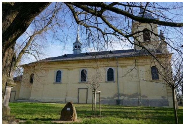
Hobšovice – sv. Václav