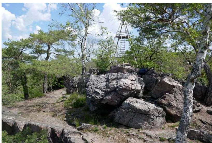
Vysoký vrch na Křivoklátsku

Tento krajinný vyhlídkový bod leží na okraji křivoklátských lesů. Jeho významné energetické místo má velkou sílu, srovnatelnou s budečskou rotundou, a nachází se na skalnatém hřebenu asi šest metrů od nivelačního bodu. Jeho energetické útvary jsou zajímavé svou velikostí – střídavý vortex má průměr asi deset metrů, křížová zóna je dvojnásobná, ještě větší je kruhová zóna a levotočivá spirála dosahuje do vzdálenosti až 15 kilometrů. Polarita vrchu je jangová. Zemská energie propojuje Střed Země s duchovním srdcem Vesmíru. Působí zde mnoho různých energií: sedmá ze Stvoření, prostory Otce Stvořitele, první grál, dimenze plazmy a éteru, třetí grál, oblast somy, jsoucnost a tři fenomény Věčnosti. Energie vrchu jsou propojeny s nejvyšším Vědomím Vesmíru, s Vědomím jsoucnosti a také s Vědomím Věčnosti. Dimenze somy kontrolují duchovní energie okolní krajiny a jsou propojeny s duchovním centrem Vesmíru. Jedno ze chvění jsoucnosti organizuje transformaci krajiny mezi Kladnem, Berounem a Zbečnem pomocí vysokých energií a vibrací ze Středu galaxie i s využitím jiných zdrojů našeho i dalších světů. Jiné chvění je trvale propojeno s Plejádami.